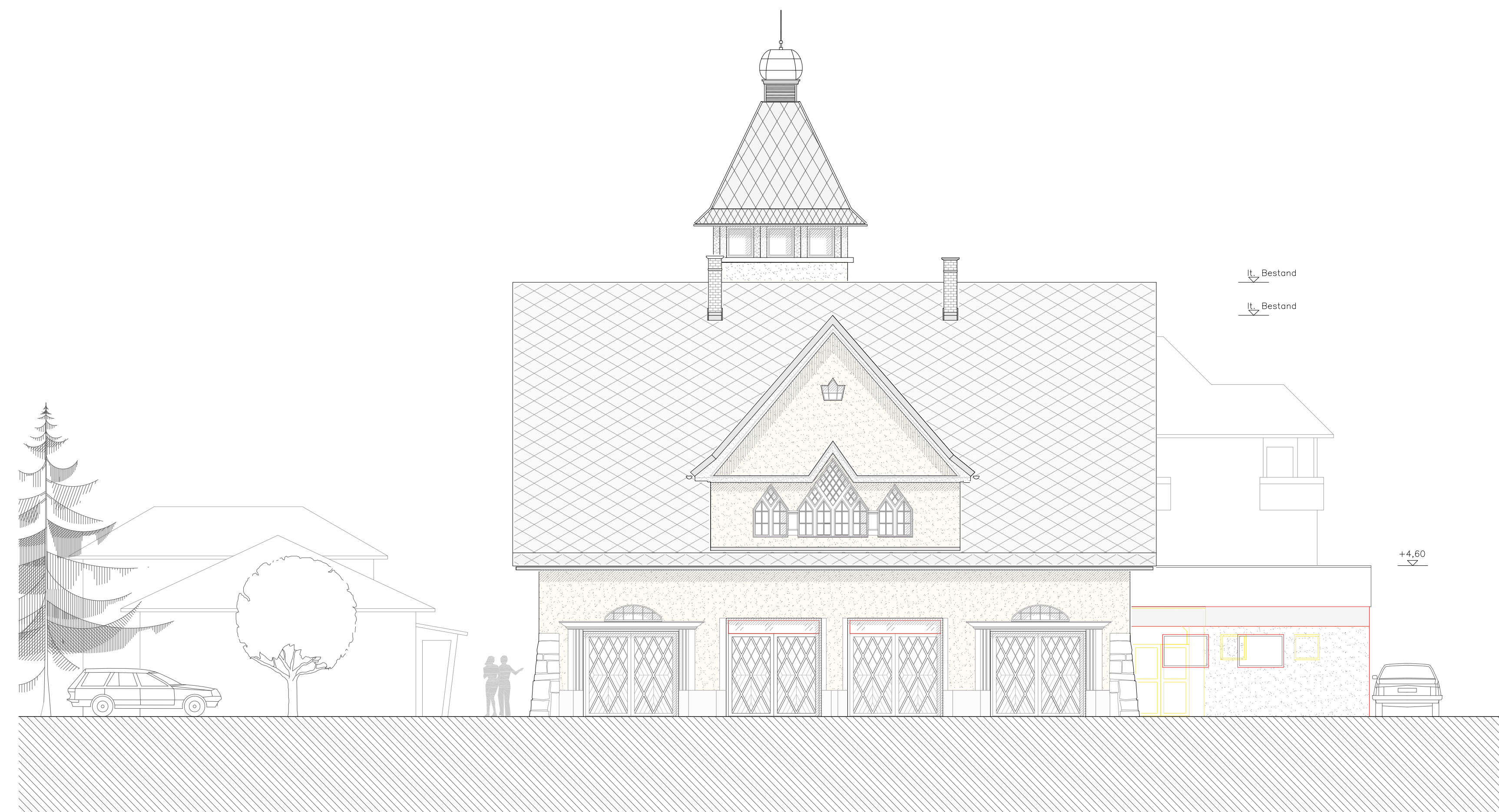
NORDANSICHT M 1:100